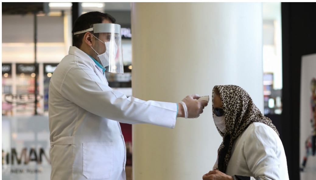
Austria identifica 155 medicamentos y 79 vacunas potenciales contra coronavirus.

NOTICIEROS TELEvisa | FUENTE: EFE | DESDE: VIENA, AUSTRIA | 20 DE ABRIL DE 2020 | 11:30 AM CST