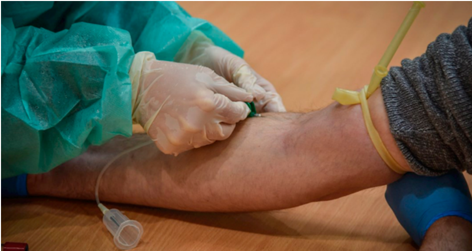
Austria identifica 155 medicamentos y 79 vacunas potenciales contra COVID-19.

Según destaca este lunes el Instituto Austríaco para el Análisis de Tecnología Sanitaria (Aihta, en sus siglas en inglés), la mayor parte de estos medicamentos que se encuentra en desarrollo contra el coronavirus ya han sido aprobados contra otro tipo de infecciones.